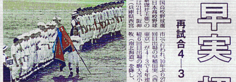
第88回全国高校野球選手権大会(日本高校野球連盟)の出場校、早稲田実業(西)と駒大苫小牧(東)が4-3で4年連続優勝。再試合は21日、阪神甲子園球場(兵庫県西宮市)で再試合。